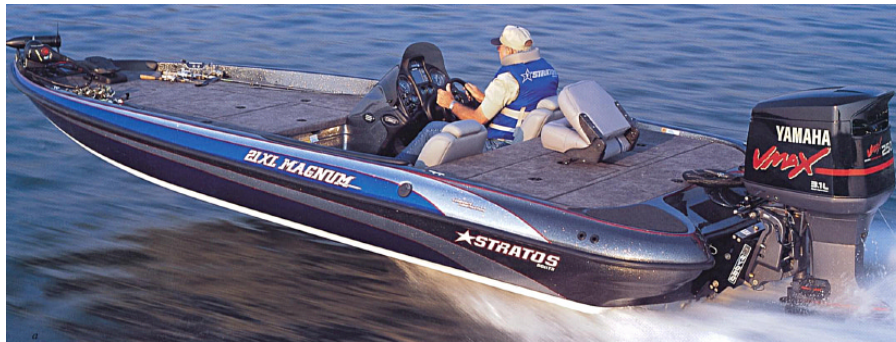
図2 VMAX250 & BassBoat

こうした市場の要望に応える形で、開発の狙いとしては従来のバス船外機に対して動力性能を向上させるとともに、十分な耐久性、信頼性を確保することを目標とした。