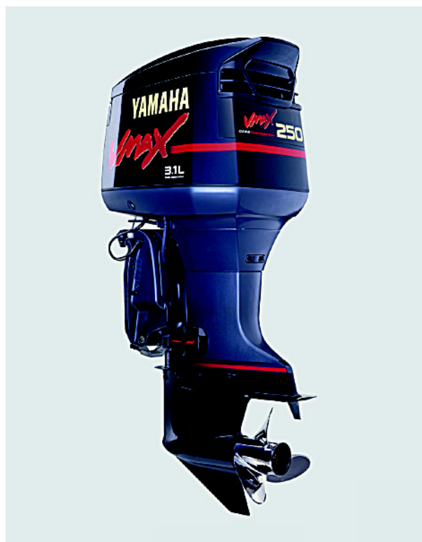
図1 VMAX 250 外観